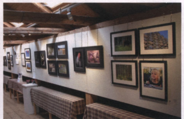
Bankeryds Fotoklubbs sommarutställning.