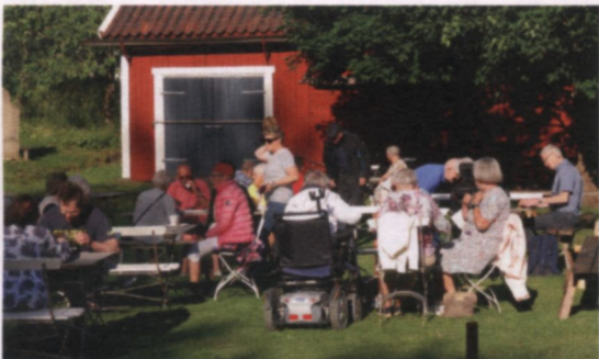
Våffelkväll på högsommaren.