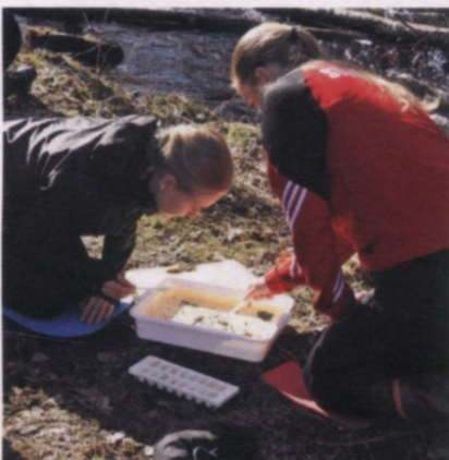
Gymnasiet på studiebesök.