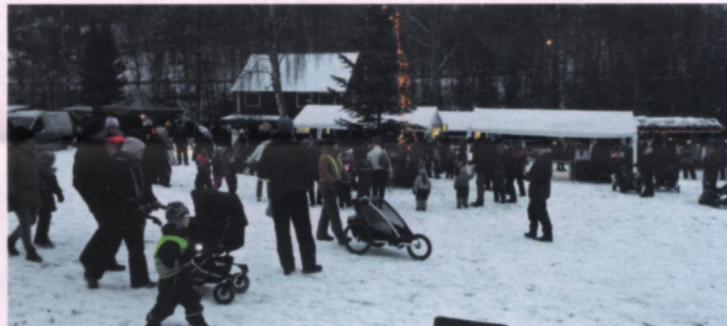
Vit Julmarknad med storpublik.