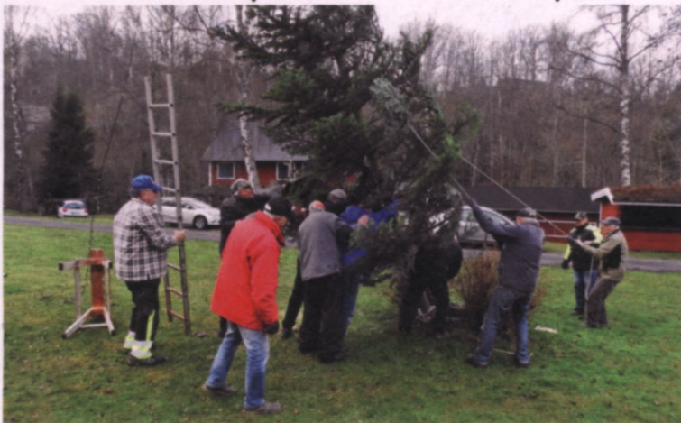
Julgranen på väg upp...