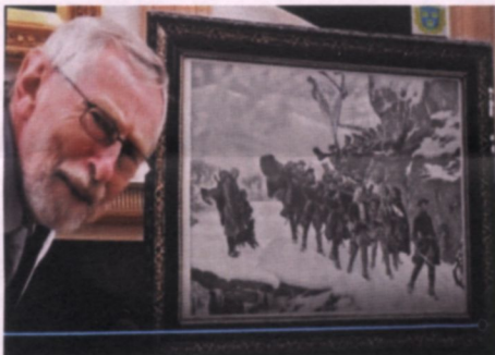
Hembygdskväll med falsk konst.