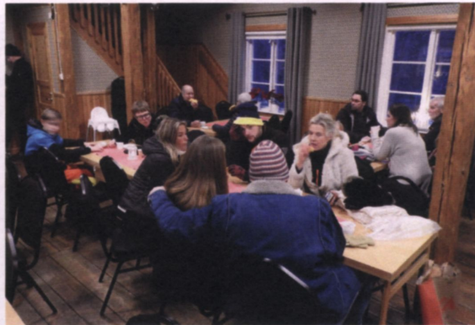
Julmarknad med kaffe i storstugan.